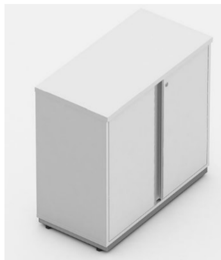
Armário de Apoio – Baixo – 2 Portas