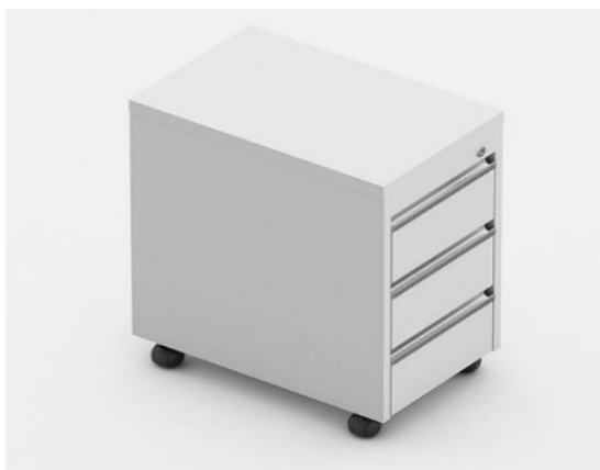
Gaveteiro Volante 3 Gavetas Normais